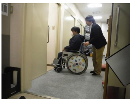
車いすによる避難誘導要領