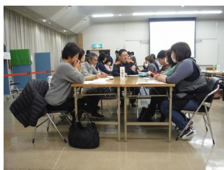
消防訓練の取り組みについての討議