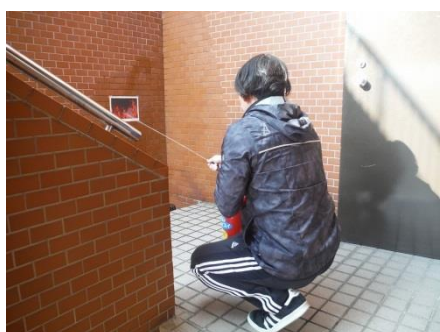
水消火器を活用した初期消火訓練

30事業所33名と多くの方に参加していただき、火災時の対応について座学のほか、火災通報装置など消防用設備等の取扱い、消火・通報・避難誘導の効果的な実施方法などを実践形式で学んでいただきました。