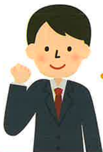
防火管理講習修了者

防火管理者は、防火管理講習修了者又は防火管理者として必要な学識経験を有すると認められる者等ではなりません。