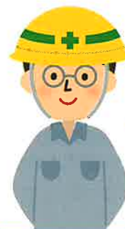
学識経験を有すると認められる者

甲種防火管理講習修了者 又は 乙種防火管理講習修了者 ※乙種防火管理講習修了者を選任できるのは比較的規模の小さい防火対象物です。