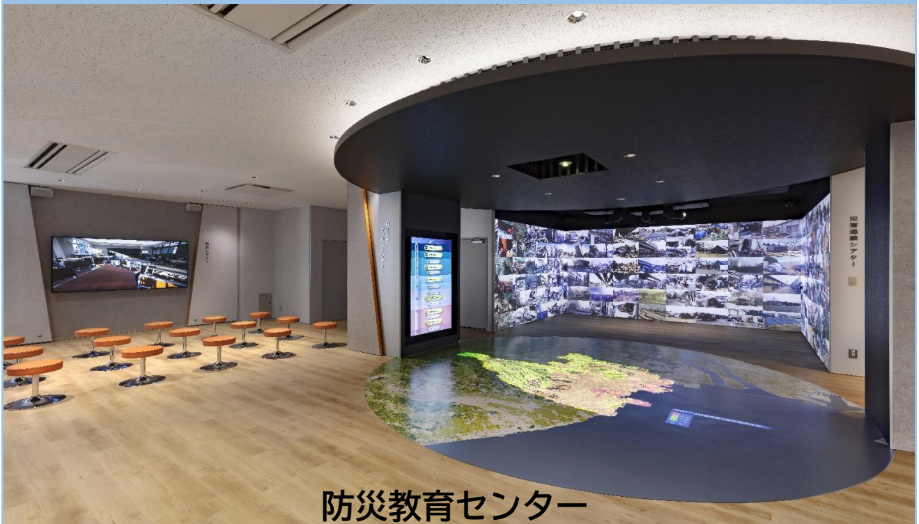
防災教育センター